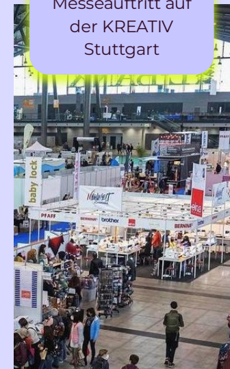
11 / 2025 Messeauftritt auf der KREATIV Stuttgart