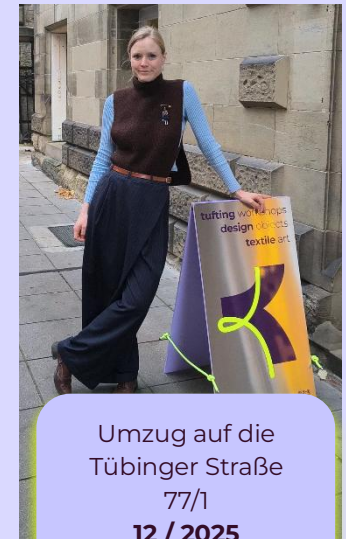
Umzug auf die Tübinger Straße 77/1 12 / 2025