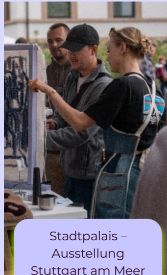
Stadtpalais – Ausstellung Stuttgart am Meer 08 / 2025