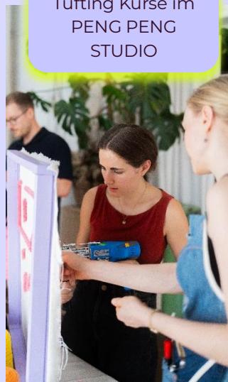
08 / 2025 Tufting Kurse im PENG PENG STUDIO