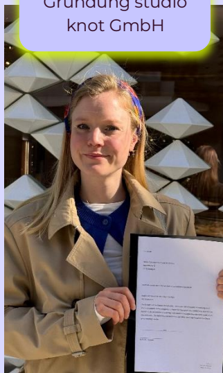
04 / 2025 Gründung studio knot GmbH