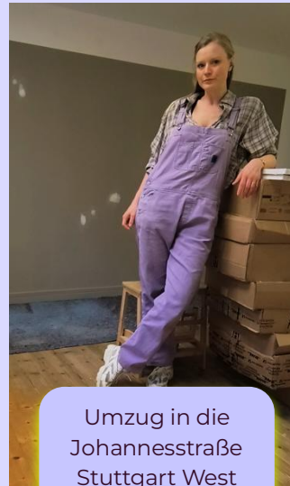
Umzug in die Johannesstraße Stuttgart West 09 / 2025