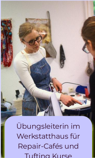
Übungsleiterin im Werkstatthaus für Repair-Cafés und Tufting Kurse 12 / 2024