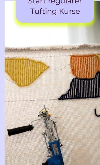
10 / 2025 Start regulärer Tufting Kurse